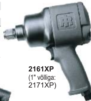
2161XP (1" võlliga: 2171XP)