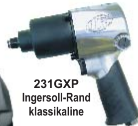
231GXP Ingersoll-Rand klassikaline