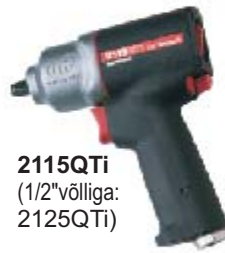
2115QTi (1/2" võlliga: 2125QTi)