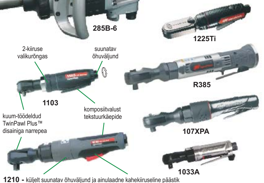
1210 - küljelt suunatav õhuväljund ja ainulaadne kahekiiruseline päästik

2) - Et tellida komplekt koos laadija ja kahe NiCd või Li-Ion akuga lisa nimetusele -2N, -2L. Kaal Li-Ion akuga